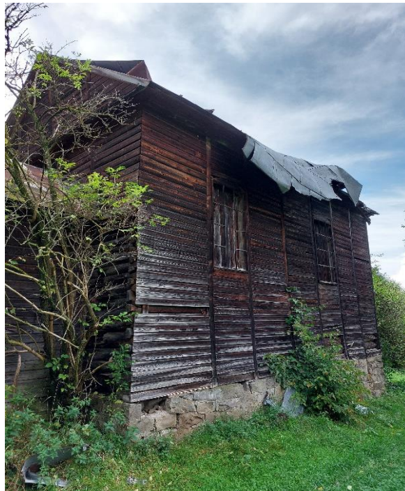
Wizyta w samorządzie terytorialnym Broshniv Osada. Zabytkowy kościół w Krechowiczach.