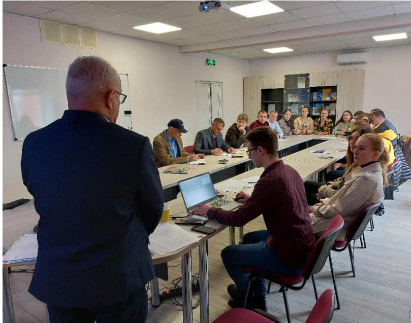
Warsztaty szkoleniowe dla studentów i wykładowców Podkarpackiego Narodowego Uniwersytetu im. V. Stefanyka w Ivano-Frankivsku