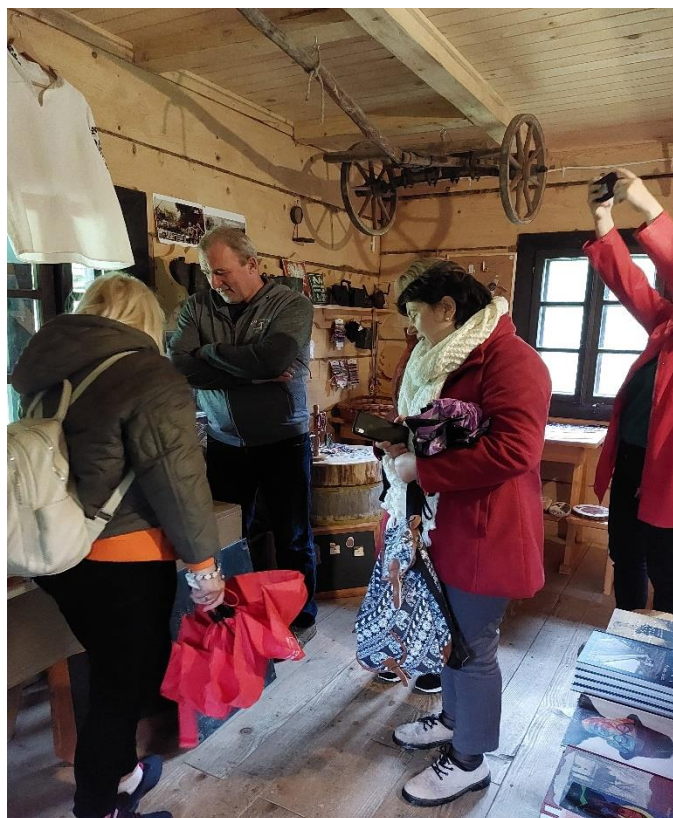
Wizyta studyjna w Zatwarnicy. Zwiedzanie zabytkowej chaty bojkowskiej.

W dyskusji panelowej zorganizowanej w Państwowej Akademii Nauk Stosowanych w Chełmie zaprezentowane zostały tematy wprowadzające do dyskusji na temat możliwości rozwoju gminy samorządowej na Ukrainie w oparciu o zachowane dziedzictwo kulturowe grupy etnicznej na przykładzie Bojków oraz w oparciu o bliskość regionu turystycznego jakim mogą być na przykład góry. Jako wprowadzenie do dyskusji przedstawione zostały wystąpienia: „Dziedzictwo kulturowe Bojków – dobre przykłady ochrony dziedzictwa na obszarze współczesnej Polski”, „Dotychczasowe badania etnograficzne nad Bojkami we Wschodniej Bojkowszczyźnie ze szczególnym uwzględnieniem obszaru północnych Gorganów w obwodzie ivanofrankivskim oraz kierunki ich kontynuowania”, „Ochrona dziedzictwa kulturowego mniejszości narodowych i etnicznych na przykładzie Chełma i regionu chełmskiego w Polsce”, „Wykorzystanie wyników badań etnograficznych Bojków na Ukrainie dla opracowywania regionalnych i lokalnych programów ochrony zabytków i rozwoju turystyki jako szansa rozwoju gmin samorządowych na przykładzie Broshniv Osada w obwodzie ivanofrankivskim na Ukrainie”.