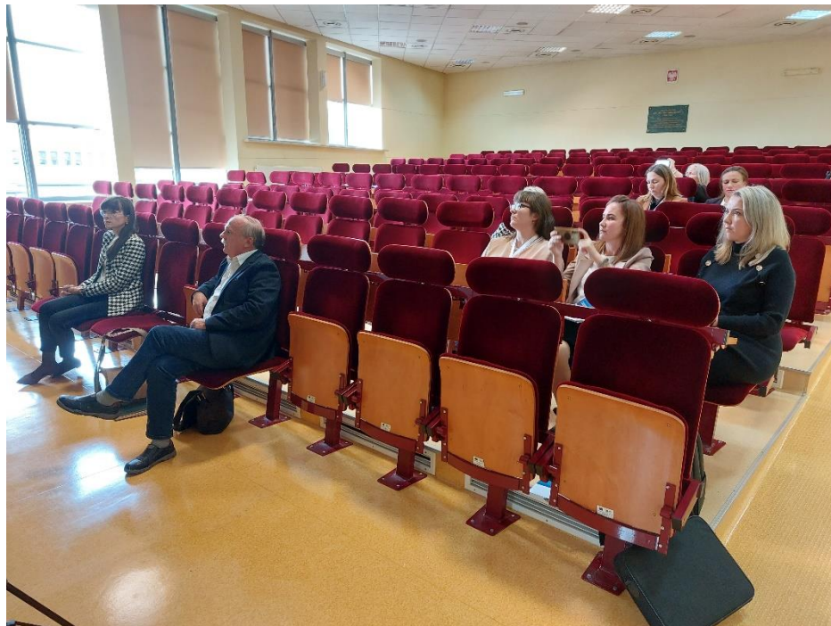
Uczestnicy panelu dyskusyjnego w auli PANS w Chełmie