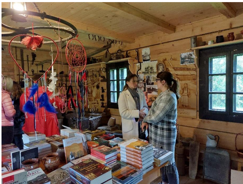
Wizyta studyjna w Zatwarnicy. Zwiedzanie zabytkowej chaty bojkowskiej.