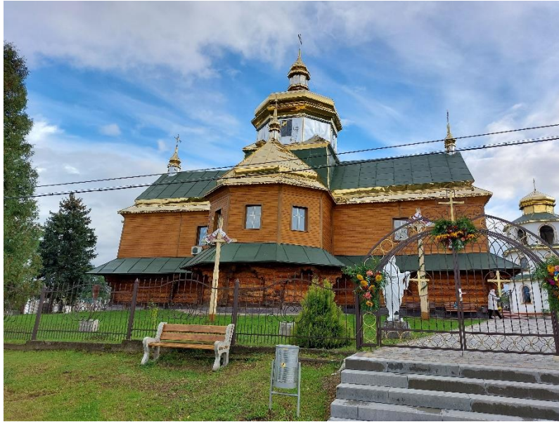
Krechowice zabytkowa cerkiew typu Bojkowskiego.

Kolejnym działaniem w ramach projektu była zorganizowana we wrześniu 2022 r. wizyta przedstawicieli Podkarpackiego Narodowego Uniwersytetu im. V. Stefanyka w Ivano-Frankivsku oraz samorządu terytorialnego Broshniv Osady w Polsce. Wyjazd studyjny do Polski rozpoczął się od zwiedzenia t. zw. Bojkowszczyzny Zachodniej położonej na terenie województwa podkarpackiego (Bieszczady i Góry Sanocko-Turczańskie). Następnie była to wizyta w Chełmie, gdzie odbyła się dyskusja panelowa poświęcona ochronie dziedzictwa kulturowego grupy etnicznej Bojków na terenie Polski i Ukrainy oraz rozwojowi turystyki i kultury na przykładzie dwóch gmin wiejskich: Siennica Różana w powiecie krasnostawskim i Wojsławice w powiecie chełmskim. Wizyty studyjne i dyskusja kontynuowana w Siennicy Różanej i Wojsławicach miała wskazać możliwości rozwoju gminy samorządowej jako dobry przykład dla gminy samorządowej Broszniv Osada na Ukrainie.