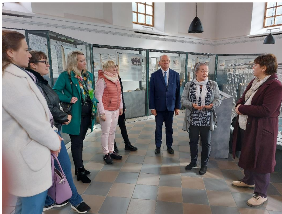
Wizyta uczestników projektu w Gminie Wojślawice. Zwiedzanie Gminnej Izby Tradycji mieszczącej się w dawnej synagodze.