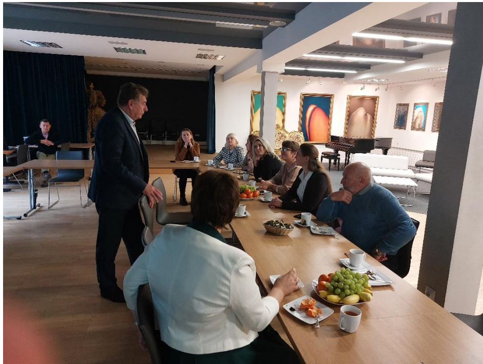
Wizyta w Gm. Siennica Różana. Spotkanie z wójtem gminy połączone z prezentacją działalności kulturalnej

Tematyka panelu była w dalszym ciągu kontynuowana podczas wizyt studyjnych składanych przez uczestników projektu w gminach powiatu krasnostawskiego i chełmskiego. W gminie Siennica Różana, w której w sposób wzorcowy rozwijane są różne formy kultury organizowane przez Gminne Centrum Kultury, Stowarzyszenie Miłośników Ziemi Siennickiej i kilkanaście organizacji pozarządowych.