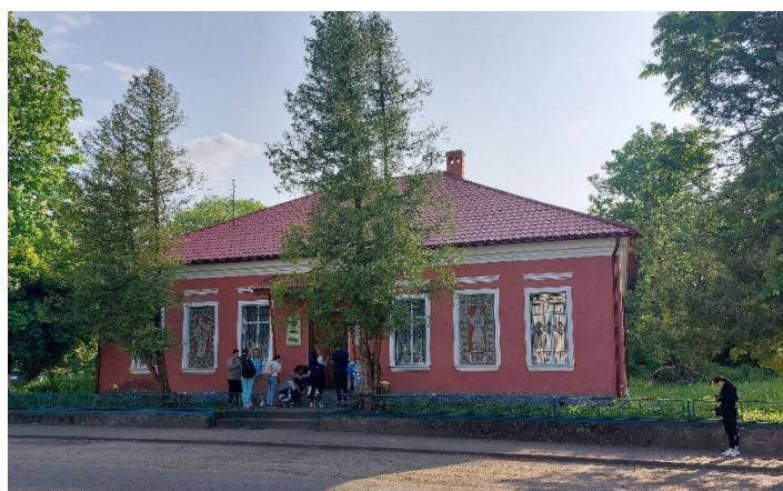
Z wizytą w Ceniawie koło Rożniatwa w Muzeum Bojkowszczyzny