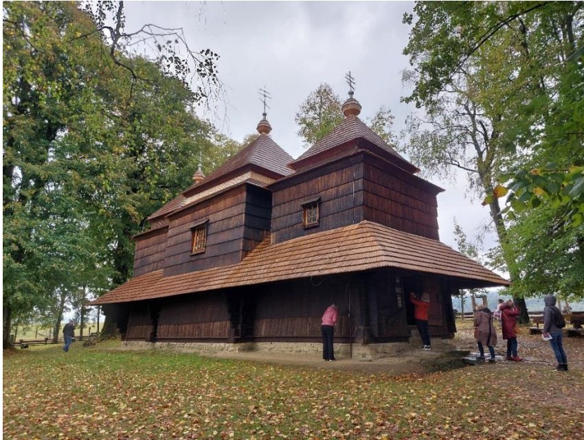
Wizyta studyjna w zabytkowej cerkwi w Smolniku wpisanej na listę światowego dziedzictwa UNESCO.