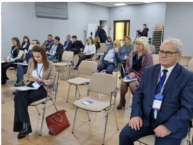
Konferencja rozpoczynająca projekt. Uczestnicy dyskusji panelowej.