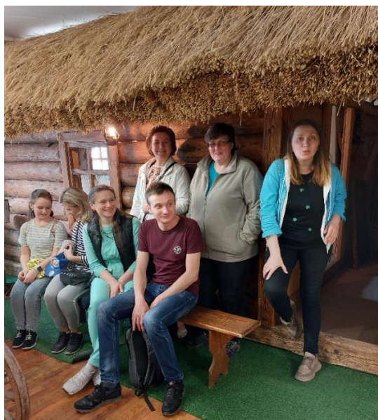
Wizyta w Muzeum Bojkowszczyzny w Dolinie.